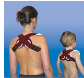
Möglichkeiten der Versorgung mit Platte, Nagel oder Rucksackverband

Ist der Bruch verkürzt und stark verschoben, dann sollte das Schlüsselbein operativ versorgt werden.